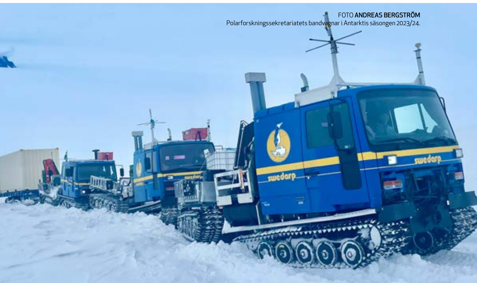
Polarforskningssekretariatets bandvagnar i Antarktis säsongen 2023/24.

Som utgångspunkt utifrån Sveriges kontinuerliga engagemang och arbete inom Antarktiskfördraget så beskrivs i denna rapport Sveriges förslag till kommande strategiska forskningsprioriteringar för fortsatt högt engagemang i Antarktis och Södra ishavet.