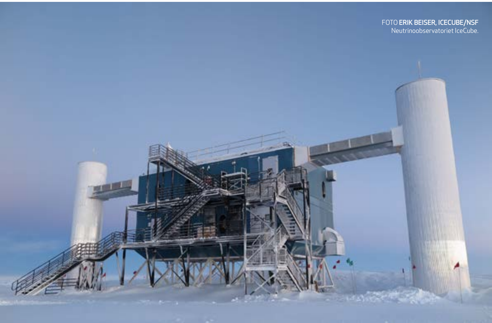
Neutrinoobservatoriet IceCube.

Vetenskapsrådet och Polarforskningssektariatet har med utgångspunkt i sin instruktion haft olika åtaganden för att stödja långsiktig planering av polarforskning samt att främja och samordna svensk polarforskning och utveckling. Forskningsfinansiärerna Formas, Rymdstyrelsen och Naturvårdsverket har bidragit till svensk akademisk polarforskning genom sina reguljära utlysningprogram till att etablera olika typer av forskarmiljöer.