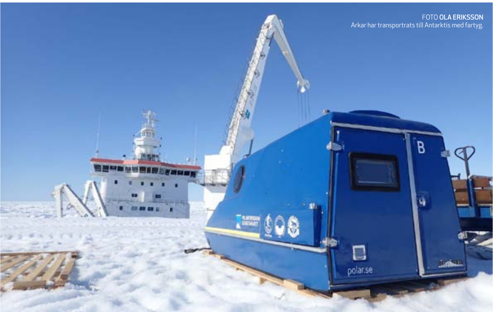
Arkar har transportrats till Antarktis med fartyg.

Detta är två viktiga forskningsplattformar där Sverige har etablerade och erkänt duktiga forskare. Utifrån ett internationellt perspektiv skulle blickarna vändas mot Sverige och de nationella forskningsplattformarna genom att tillgängligheten till fler forskningsmiljöer förbättras. Det skulle kunna vara ett viktigt skyltfönster som främjar utveckling av både forskningsområden och samarbeten.