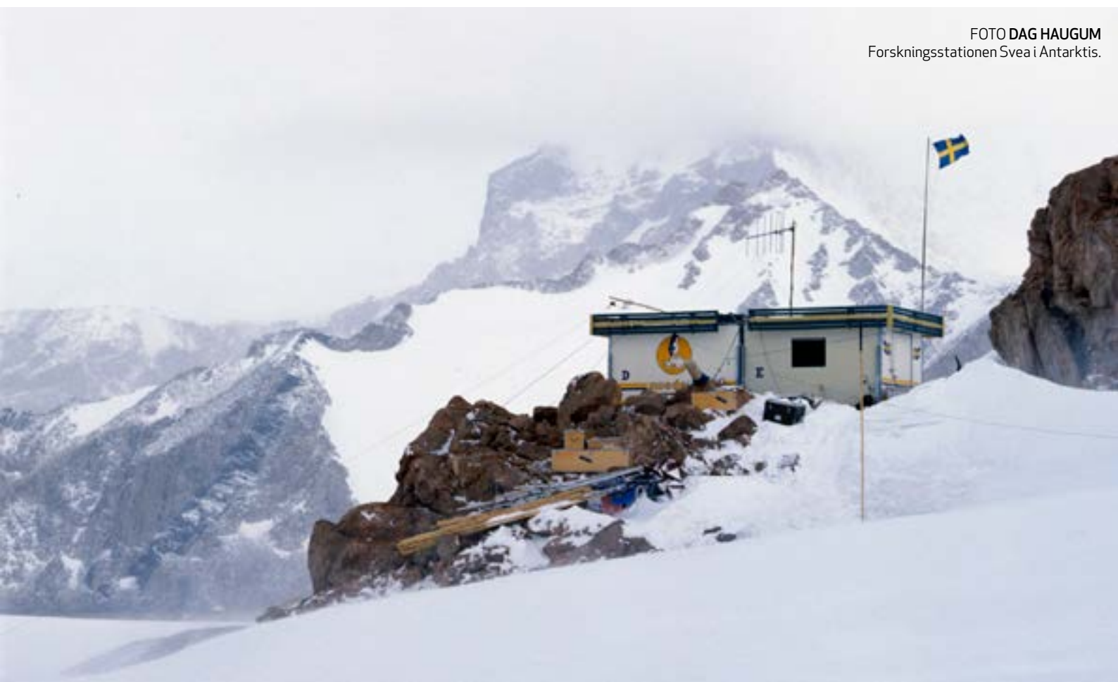
Forskningsstationen Svea i Antarktis.

Ett stärkt svenskt engagemang i internationella samarbeten är värdefullt ur flera aspekter. Det ökar svenska forskares möjligheter att bedriva forskning i områden där Sverige saknar infrastruktur. Det skapar också möjligheter för svenska forskare att medverka i fler internationella forskningssatsningar, samt skapar förutsättningar för att svensk Antarktisforskning ska kunna bidra med en större akademisk bredd. Till detta kan även politiska aspekter räknas in. Ytterst innebär en stark Antarktisforskning också en stark röst i frågor som rör den gemensamma och internationella förvaltningen av kontinenten eftersom forskningen stödjer olika behov i förvaltningen av kontinenten. Sveriges engagemang i det internationella samarbete som rör Antarktis har historiskt genererat politiska värden. Från det att Sverige fick tillträde till förhandlingsbordet gällande viktiga frågor som den gällande utvinning av mineral, utarbetande av Miljöprotokollet (där Sveriges engagemang bidrog till ett förbud mot utvinning av mineral) – till