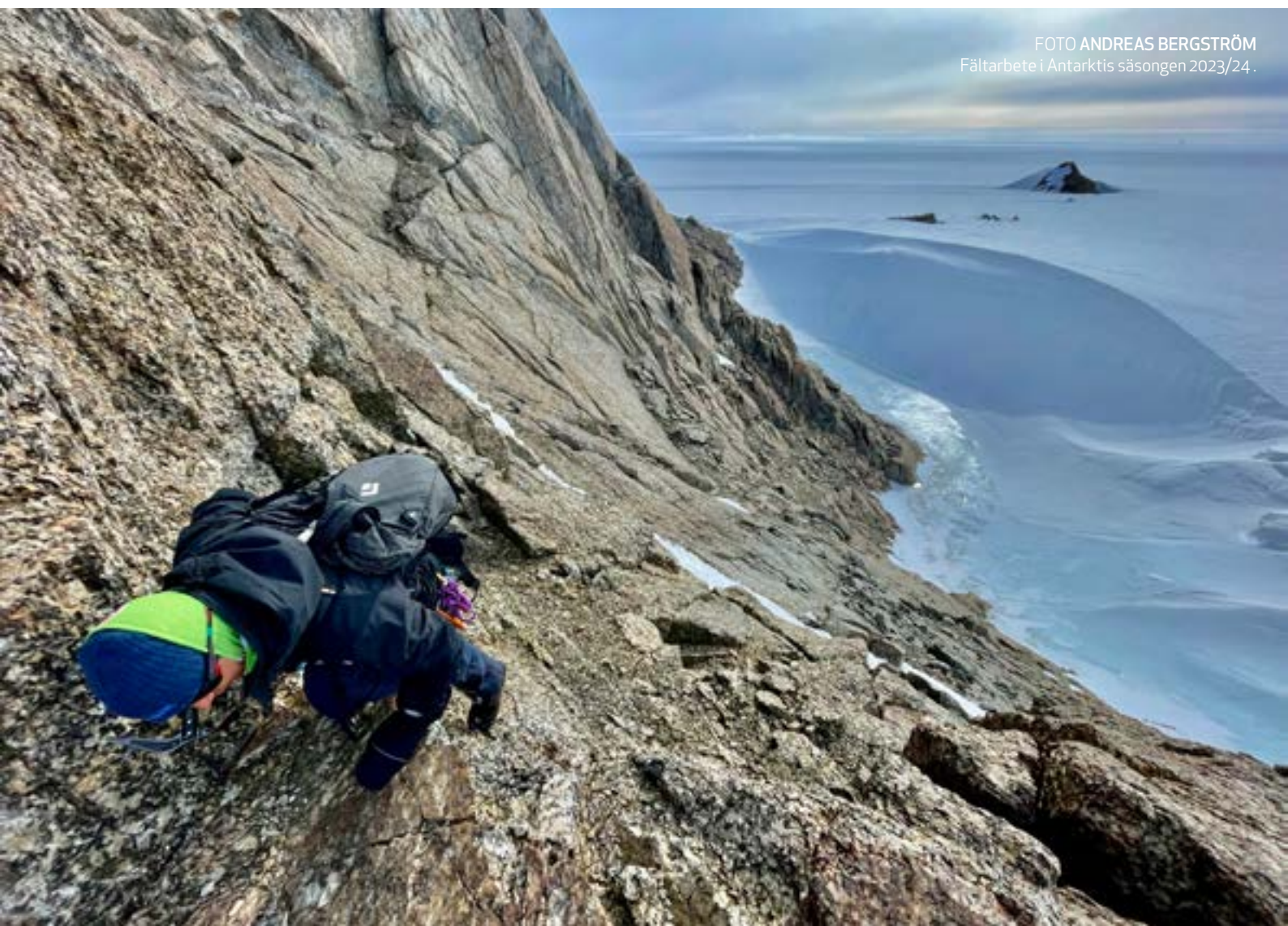
Fältarbete i Antarktis säsongen 2023/24.

Framtagandet av ett svenskt tillvägagångsätt för forskningssamordning samt främjandet av miljö- och innovationsteknologi skulle öka intresset och medvetandet för Sveriges polarforskning med tillhörande verksamhet. Följande myndigheter skulle med fördel för Antarktisstrategin kunna ingå i nationell myndighetssamverkan, Vetenskapsrådet, FORMAS, Rymdstyrelsen, Havs och vattenmyndigheten, SIDA, Riksantikvarieämbetet, Naturvårdsverket, SMHI och Naturhistoriska riksmuseet.