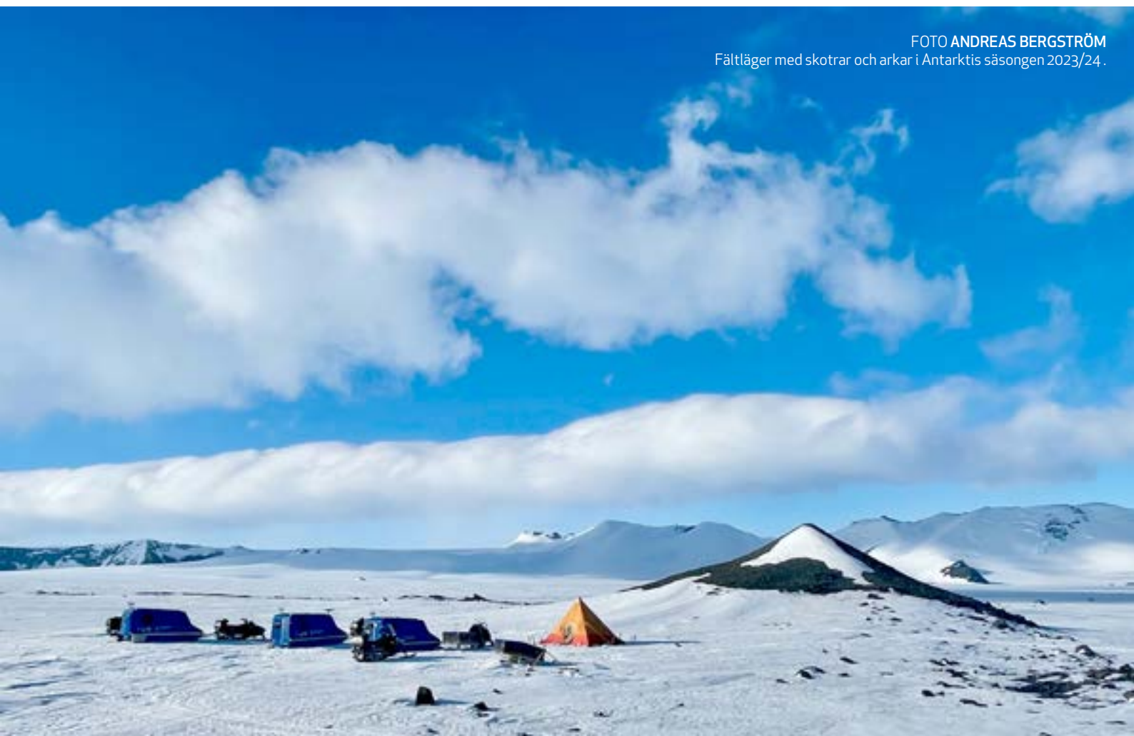
Fältläger med skottrar och arkar i Antarktis säsongen 2023/24.

Polarforskningssekretariatets huvudsakliga uppgift är att organisera och stödja forskningsexpeditioner till polarområdena och ansvara för forskningsinfrastruktur. Medel som huvudsakligen kommer genom det årliga förvaltningsanslaget och som motsvarar cirka 50 miljoner kronor, vilket ska omfatta hela myndighetens verksamhet. Myndigheten får även bidrag på sju miljoner kronor årligen via Formas för drift och hyra av isbrytaren Oden i samband med arktisk forskningsverksam-