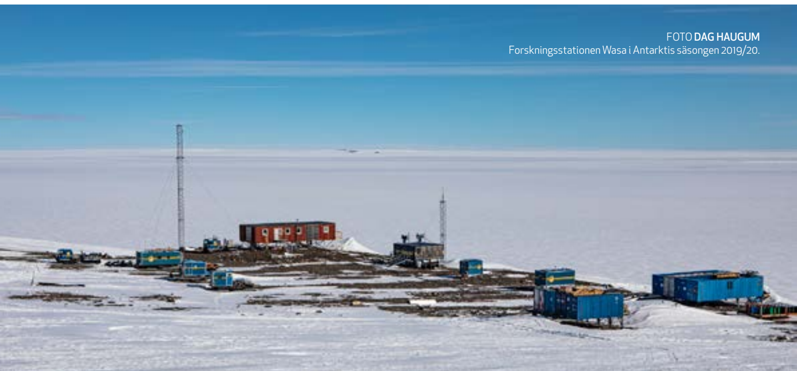
Forskningsstationen Wasa i Antarktis säsongen 2019/20.

Transporter till och från Antarktis sker i samarbete med andra nationer som är verksamma i Dronning Maud Land, främst Finland, Norge, Tyskland och Sydafrika. Vid Wasa finns bandfordon (Hägglunds bandvagnar samt snöskotrar), bostadsmoduler och slädar som medger att fältforskning kan bedrivas inom ett stort område runt de svenska stationerna. Systemet att färdas på inlandsisen med bandfordon och bostadsmoduler är välutvecklat och beprövat, och leds av erfaren personal. Navigation sker på ett säkert sätt med hjälp av högupplösta satellitbilder och globala satellitnavigeringssystem (GNSS). Fältforskning kan också ske med hjälp av flygplan som har förmåga att landa med skidor på opreparerade snöytor.