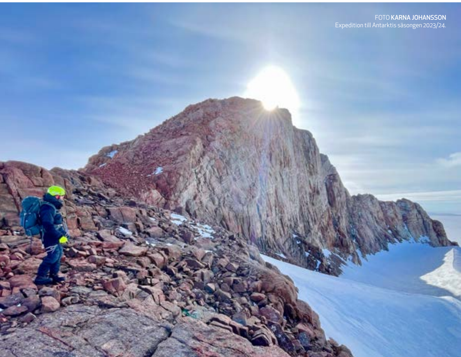
Expedition till Antarktis säsongen 2023/24.